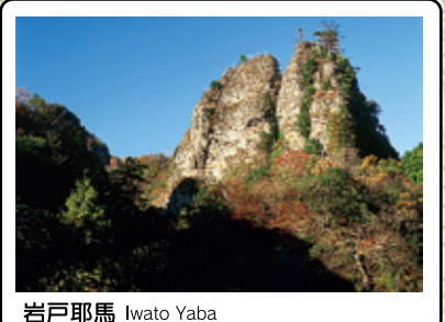
岩戸耶馬 Iwato Yaba