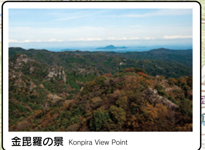
金毘羅の景 Konpira View Point